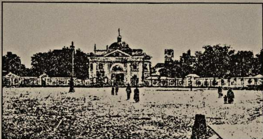
Петрогр. Александрo-Невская лавра.